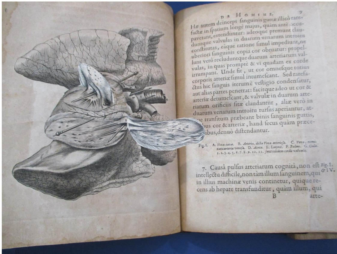
Renatus Descartes, De Homine figuris et Latinitate donatus a Florentio Schuyf, Lugduni Batavorum, Franciscum Moyardum & Petrum Leffen, 1662 Collection Piero Marengo

Parmi tous ces ouvrages spectaculaires, signalons le De Homine de Descartes (1662), montrant deux volets imprimés recto et verso pour dévoiler la structure interne du cœur, avec les valves, poumons, vaisseaux et nerfs. L'ouvrage est considéré comme le premier traité européen moderne sur la physiologie.