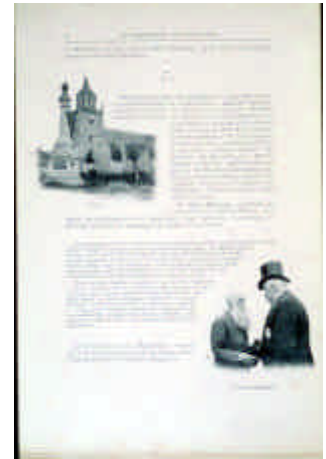
ILL. 39 - PAUL GERS, Voyage du Président de la République en Bretagne, 1896.

Photo-journal, journal des sociétés photographiques, voué à l'illustration photographique. À partir de 1890, il entreprend également la publication de plaquettes sur les voyages du président. Le voyage de M. Carnot, publication luxueuse, est suivi d'une vingtaine d'autres brochures, parues entre 1890 et 1900. La plupart de ces publications sont des éditions de luxe, illustrées de photographies d'après nature. L'année de l'Exposition du livre, Paul Gers publie M. Carnot dans l'Est chez Flammarion.