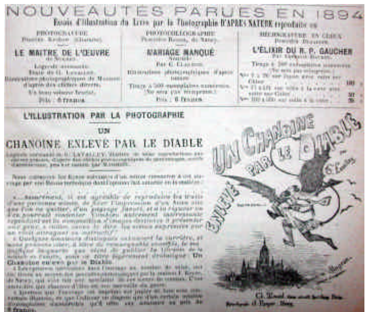
ILL. 36 - Publicité Charles Mendel in Photo-revue

Il est au passage intéressant de remarquer que le Musée de photographies documentaires français est fondé au Cercle de la librairie, à proximité des plus puissants éditeurs.