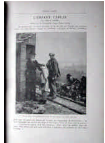
ILL. 46 - Albéric LUNDEN, « L'Enfant espion » d'A. Daudet, Photo-magazine, 1904.

encourage ses lecteurs à réaliser photographiquement les compositions pour lesquelles il aurait fait appel aux dessinateurs. Revue mensuelle de demi-luxe (10 F/an) de grand format, Photo-magazine offre ainsi une place privilégiée à l'illustration et, en particulier, à l'illustration de textes littéraires par la photographie d'après nature. La couverture est illustrée d'une photographie et le corps de la revue est composée de huit pages sur papier glacé. Elle comprend trois articles de fond amplement illustrés, un article technique, présenté le plus souvent sous forme d'anecdote et une planche hors-texte, réalisée le plus souvent par un amateur. Pour répondre à la demande formulée par les lecteurs des éditions Mendel, elle est de plus agrémentée de rubriques divertissantes : « légendes photographiques », « albums pittoresques ». Les quatre pages centrales forment quant à elles une troisième partie. Portant le titre de « Photo-album », elles sont indépendantes et destinées à contenir les épreuves envoyées par les amateurs. L'ensemble des numéros de 1904 accueille dans cette partie une œuvre littéraire illustrée (L'Enfant espion d'A. Daudet illustré par A. Lunden et Fenaison d'André Theuriet, illustrations anonymes).