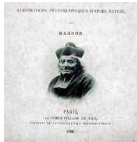
ILL. 41 - Le Curé du Bénizou, page de couverture.