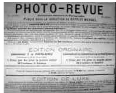
ILL. 44 - Publicité pour Photo-revue

de photographie, de plus en plus friande d'informations, constitue le cœur de cible de la plupart de ces produits éditoriaux. Le premier pallier de cette réussite est l'immense succès rencontré par son premier journal hebdomadaire, entièrement consacré à la photographie, Photo-revue. 501 Première revue hebdomadaire de photographie en France, elle est vendue 10 centimes. La politique de distribution de masse qui l'accompagne (prix bas, distribution en gare, 502 abonnement des sociétés de photographie) fait d'elle un produit particulièrement rentable. Elle alimente le lancement de titres nouveaux, une vingtaine entre 1888 et 1906, et constitue le pivot de l'œuvre de vulgarisation entreprise par Charles Mendel. L'amateur y découvre les nouveautés, obtient des conseils et des renseignements et y publie parfois ses propres travaux ou articles. Le programme fixé pour Photo-revue est d'œuvrer pour la vulgarisation et la diffusion de la photographie, la défense des intérêts matériels et moraux des photographes et des amateurs et la publication