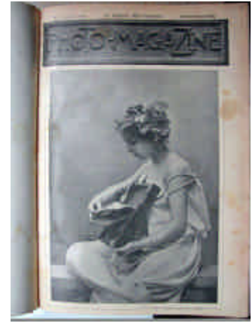
ILL. 45 - Photo-magazine, Page de couverture, 1 ère année, n°1, 1904.

en vente dans les principaux théâtres de Paris, chaque numéro, illustré de similigravures, contient les portraits et biographies des auteurs et des principaux interprètes et offre, pour la première fois, au lecteur la reproduction photographique des principaux « tableaux » de l'œuvre représentée (six reproductions). Vouée à remplacer le simple programme distribué dans les théâtres, la revue illustrée est complétée de l'historique du théâtre, du plan de la salle, du prix des places, de la distribution et d'un compte-rendu. Les clichés sont réalisés par Paul Boyer, spécialisé dans les reproductions scéniques à la lumière artificielle.