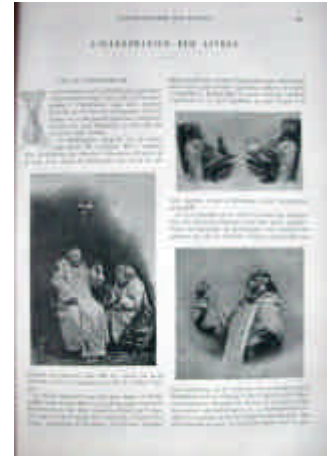
ILL. 38 - Henri MAGRON, L'Élixir du Révérend père Gaucher, Illustrations extraites du Livre à travers les âges

Après avoir parcouru une série de salles désertes au premier étage, nous avons fini par découvrir l'emplacement réservé à la photographie. Cette salle est à peu près nue, la moitié des exposants n'ayant encore rien envoyé. 376