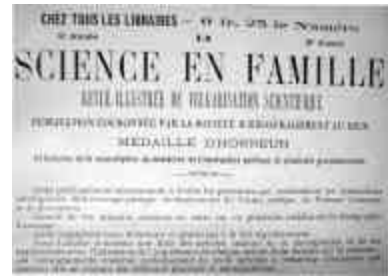
ILL. 42 - Publicité pour La Science en famille