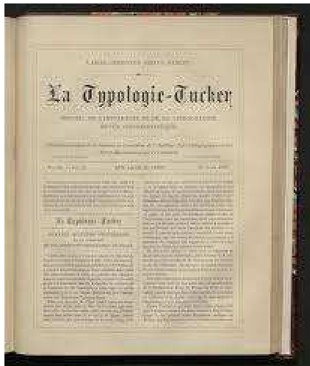
La Typologie Tucker

D'ailleurs, Tucker mort on s'empressa de modifier l'intitulé de son journal, qui devint la Typologie tout court.