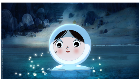
Le Chant de la mer , Film d'animation de Tomm Moore, ( Song of the Sea , Irlande/France/Luxembourg), 2014. Reproduction.