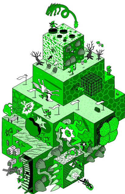
Alex Chauvel, illustration pour le chapitre « Une Histoire qui s'écrit en marchant », dans l'ouvrage Zelda, Le Jardin et le monde , Éditions Façonnage, 2021