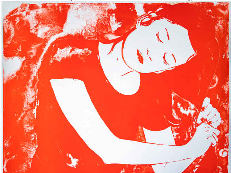
Françoise Pérovitch, Se Coiffer , 2016 © Adagp, Paris, 2023

> Une visite autour du musée à la découverte 4de la couleur dans le street art