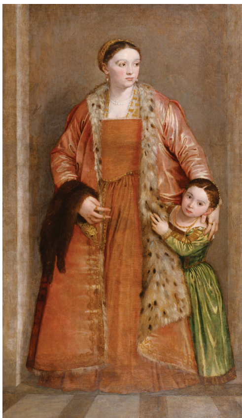
Véronèse, Portrait de la Comtesse Livia da Porto Thiene et de sa fille Deidamia , 1552. Huile sur toile, 208.4 x 121 cm, Walters Art Museum (inv.37.541), Baltimore, États-Unis. Reproduction.