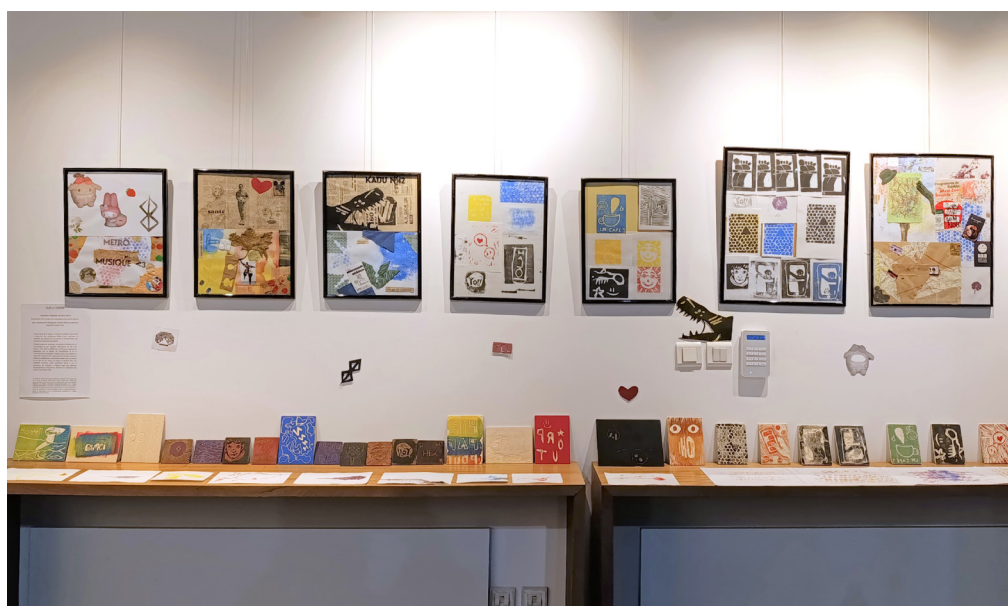
L'exposition à la Ferme du Vinatier