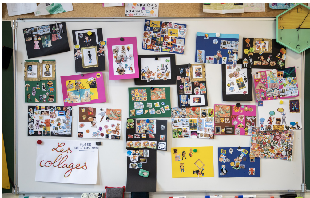
Les collages réalisés par les élèves accrochés au tableau.

Ce projet montre que le musée peut exister partout, avec tout le monde.