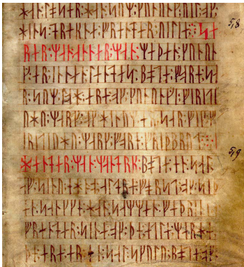
Des signes d'écriture