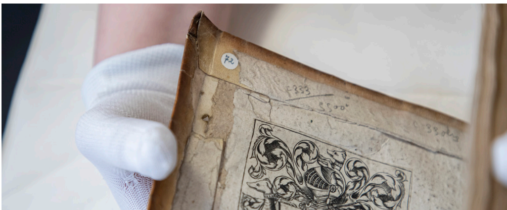
Des marques sur un livre des collections du musée

Plus tard, ces objets et ces livres entrent dans les collections du musée.