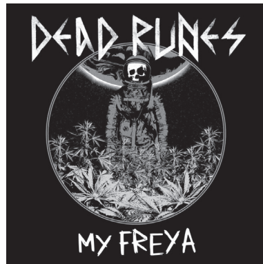
Une pochette de disque