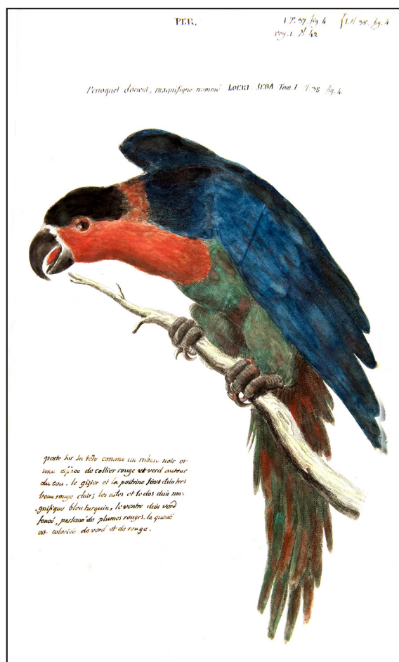
Image d'une page d'un livre des collections