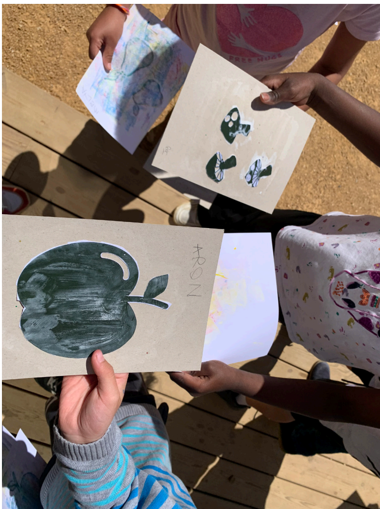
Des créations d'enfants en 2024

Adresse : 505 avenue de la Sauvegarde 69009 Lyon