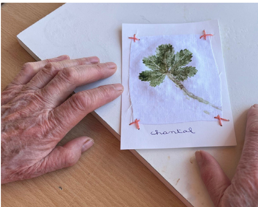
Le résultat de l'atelier