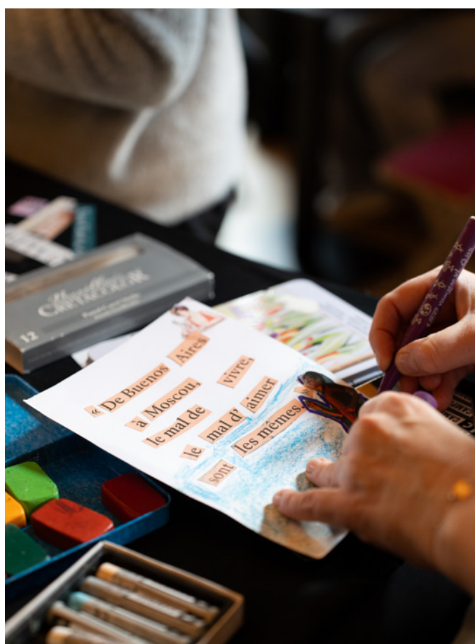
Un atelier au Théâtre des Célestins