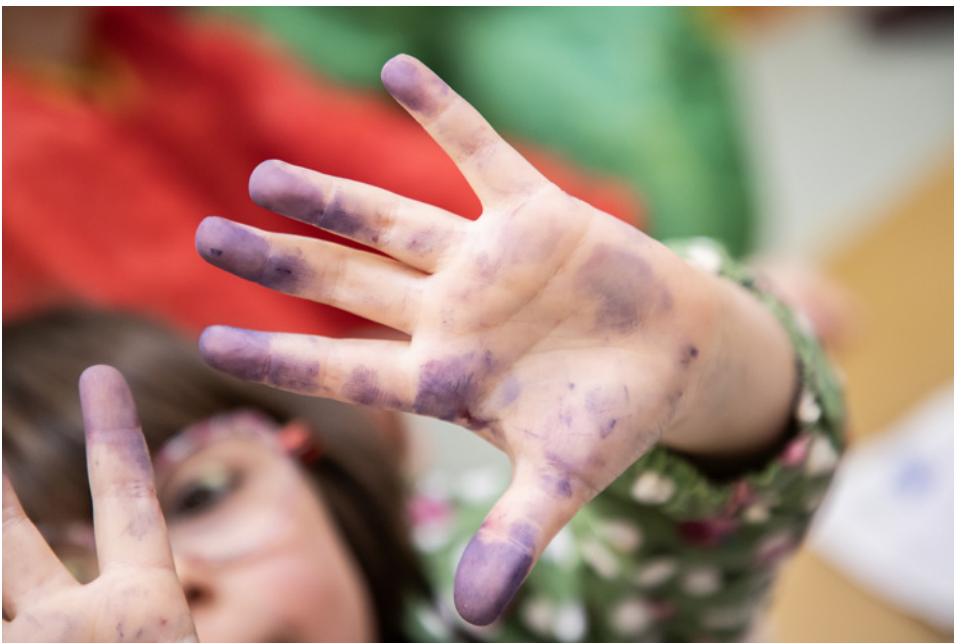
Des mains d'enfant pleines d'encre

L'objectif est que les publics regardent, mais aussi touchent et participent.