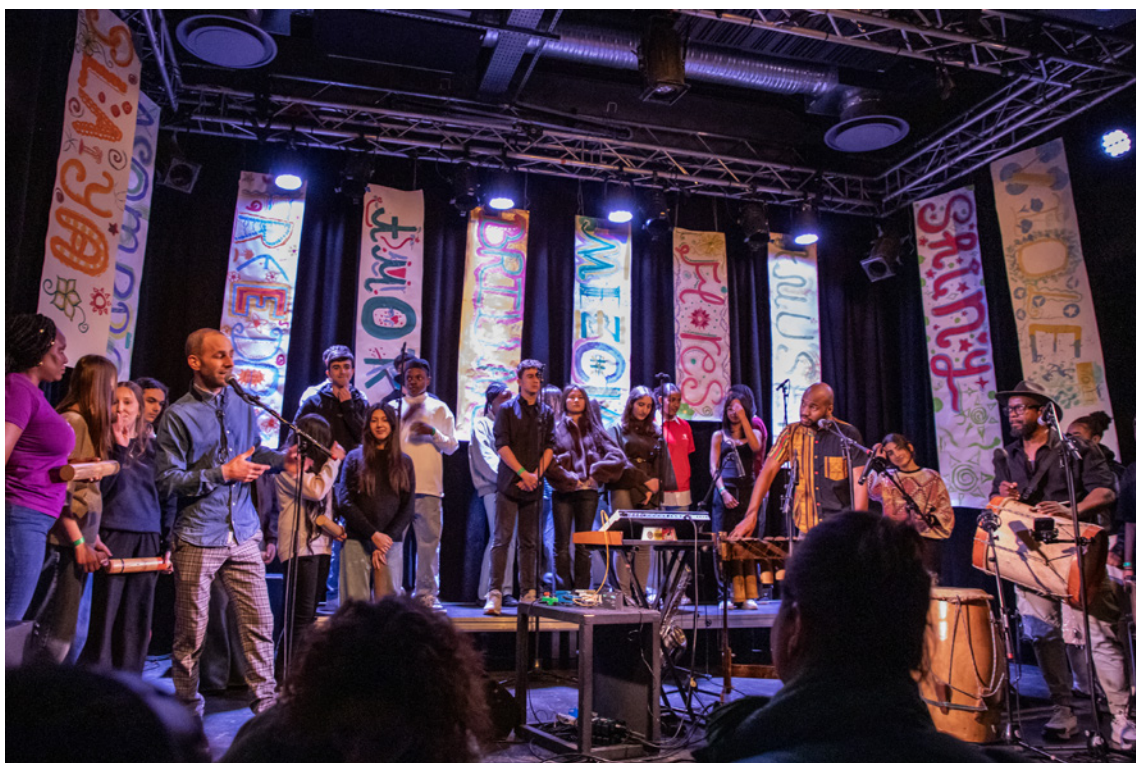
Le concert, résultat des ateliers

Le résultat est une belle création musicale et graphique.